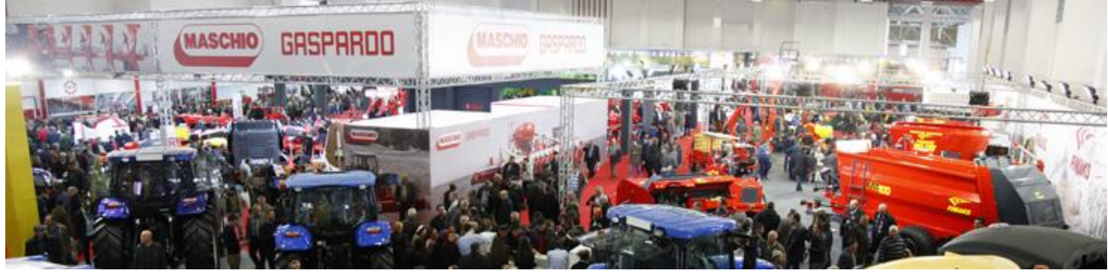
ما غول‌های جهان را دور هم جمع کرده‌ایم.