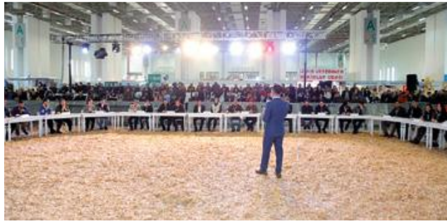
"رقابت بین دانش کشاورزان جوان"