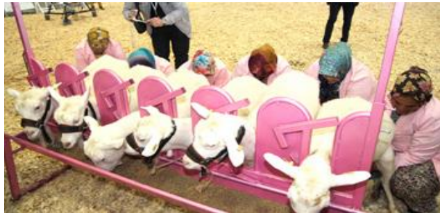
مسابقه زیباترین حیوانات برای گریه، گوسفند و بز

/www.agroexpo.com.tr/en/ikili-gorusme-formu