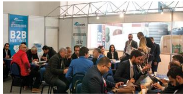
برگزاری جلسات B2B رایگان در سالن اجتماعات، ثبت‌نام آنلاین:

/www.agroexpo.com.tr/en/ikili-gorusme-formu